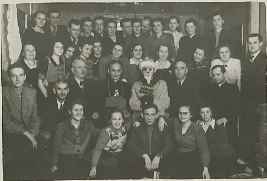
Rozpoczęło się tenor zabawa tańcowa w ścisłej zaanektuście oncie, która przy dźwiękach notek...

Wspólny fotograf z gwiazdorem zakończono część oficjalną.